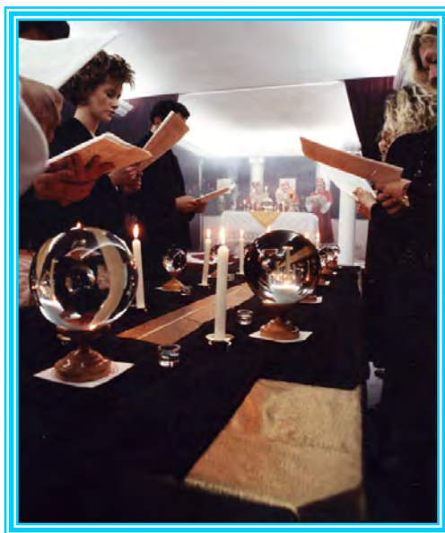
Rituale di Consacrazione della sfera di Cristallo

Riproduzione facsimile del policromo diploma rilasciato al termine dei corsi agli allievi meritori.